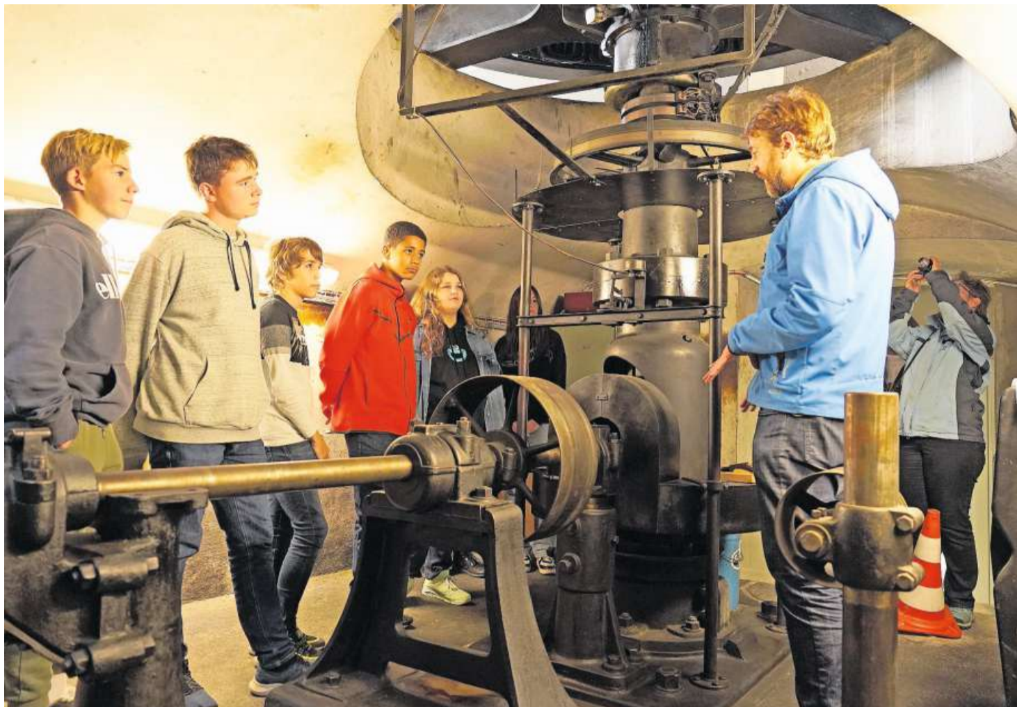
Die Schülerinnen und Schüler betrachten einen alten Generator.